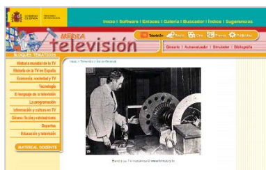
Mapa temático TELEVISIÓN

Estas y muchas preguntas más son respondidas en este portal, donde además podrás encontrar enlaces de contenido que te ayudará a formar a tus comunicadores locales, quienes además de tener un adecuado manejo de las herramientas digitales, se les debe ofrecer contenido para reflexionar.