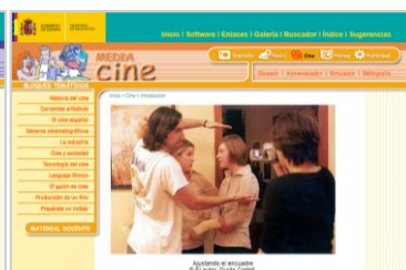
Mapa temático CINE