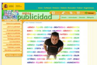
Mapa temático PUBLICIDAD