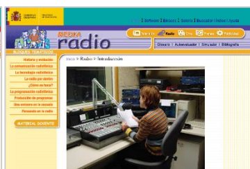
Mapa temático RADIO