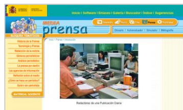
Mapa temático PRENSA